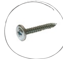
TYPE DE VIS: INOX #8 LONGUEUR: 1.25 POUCHES TÊTE: #8 - ÉTOILE

Il est recommandé d'utiliser les vis disponibles chez Rialux. Les vis doivent être vissées au centre des ouvertures prévues à cet effet et de manière modérée. Il est important de ne pas exercer de pression vers le haut ou vers le bas. Vérifiez l'installation à tous les 3 ou 4 rangs pour s'assurer que le travail est effectué correctement. Pour une meilleure inspection visuelle, veuillez retirer la pellicule de protection au fur et à mesure lors de l'installation.